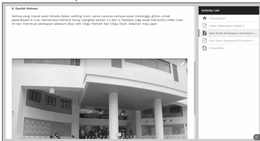
Rajah 1 : Latihan Lisan - Menonton Video

Rajah 2 merupakan latihan atau soalan bagi menggalakkan murid untuk memberikan pendapat dengan memberikan sebab dan bagaimana sesuatu isu berkaitan dengan topik dihuraikan.