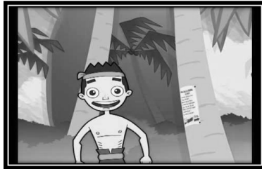
Rajah 1: Contoh Kata Tanya – Siapa Dalam Cerita Rakyat ‘Tanggung’

Tanggung dan keluarganya tinggal di sebuah kampung. Ibu Tanggang bernama Deruma. Bapanya pula bernama Talang. Talang bekerja sebagai seorang nelayan. Kehidupan mereka amat miskin. Tanggang merupakan seorang kanak-kanak yang bercita-cita tinggi. Dia ingin menjadi kaya dan terkenal. Namun, dia tiada peluang untuk mencapai cita-citanya.