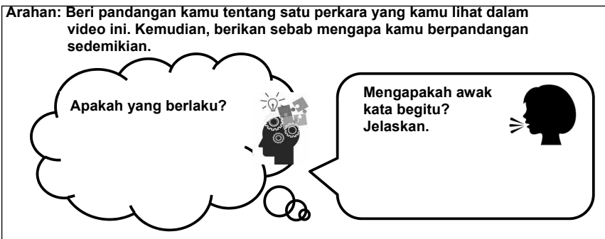
Rajah 2: Templat Rutin Berfikir

Teknik drama Kerusi Panas atau Hot Seating juga digunakan untuk membantu murid meraih pengalaman atau mendapatkan respons secara langsung daripada seorang watak utama dalam klip video yang dibina oleh