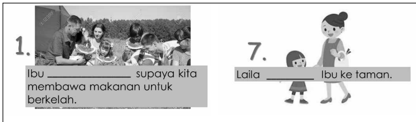
Rajah 3: Contoh Latihan Kosa Kata Dalam Portal SLS

Selain itu, satu penjelasan bagi markah latihan kosa kata dalam portal SLS yang lebih tinggi adalah disebabkan ia diselesaikan seurus selepas murid menonton video PdP – maka mereka lebih mengingati apa yang baru sahaja dipelajari dan menonton semula video pada bila-bila masa sewaktu menyelesaikan latihan kosa kata di SLS – fleksibiliti ini mungkin ada kesan kebaruaran ( recency effect ) pada markah yang diraih. Manakala, latihan pascapencelahan dijalankan pada hari yang berikut, dan murid mungkin telah terlupa apa yang dipelajari. Justeru, aplikasi yang berterusan bagi penguasaan kosa kata amatlah penting untuk mencapai kesan pengekaln.