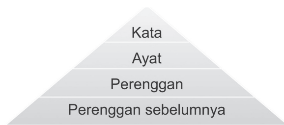
Rajah 2: Piramid PetaK

Setelah menetapkan teknik yang menjadi sandaran kajian pengajaran, para pengkaji telah menyiapkan satu Rancangan Pengajaran (RP) yang asas. RP tersebut telah diubah suai oleh kedua-dua sekolah mengikut profil pelajar kedua-dua sekolah.